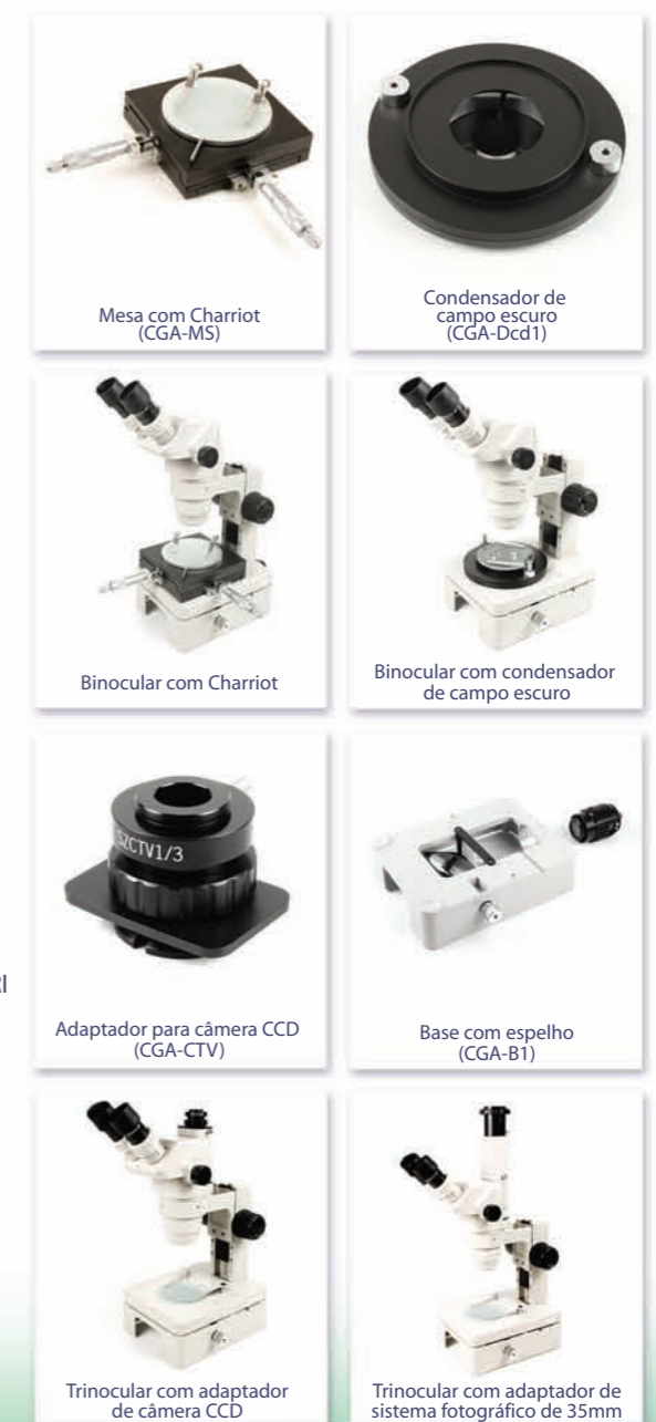
Mesa com Chariot (CGA-MS)